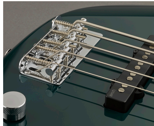
Un encordado en diagonal a través del cuerpo

Los bajos de la serie BB de Yamaha utilizan un encordado en diagonal a través del cuerpo, en el que las cuerdas se angulan en la silleta y pasan a través del instrumento, hasta el puente, en un ángulo de 45°, en oposición al método de encordado vertical tradicional, que pone más tensión en las cuerdas. El encordado en diagonal a través del cuerpo reduce considerablemente esa tensión, al tiempo que transmite la vibración de las cuerdas al cuerpo de manera confiable y eficiente. Las cuerdas también se pueden fijar al cordal del puente, que viene equipado con una silleta convertible que se puede ajustar en dos ángulos diferentes para una conformación y sensación tonal más precisa. El lado más