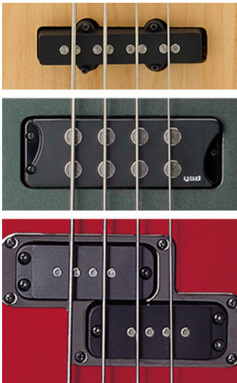
Desde arriba: bobina única, bobina humbucker, bobina dividida

Preamplificación Pasiva: Los sistemas de preamplificación pasiva funcionan sin fuente de alimentación y tienen menos controles; por lo general, una perilla de volumen, una perilla de tono y un control de mezcla si hay dos pastillas. Una ventaja