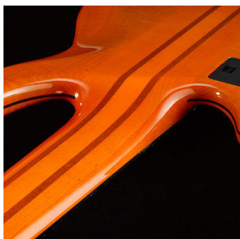
Arriba: seis tornillos para fijar el mástil Abajo: mástil corrido

Atornillado: La mayoría de los bajos tienen mástil atornillado; es decir, el mástil se atornilla al cuerpo. Los tornillos deben mantener el mástil estable y no permitir ningún desplazamiento hacia arriba o abajo. Es esencial que haya una conexión sólida y firme entre el mástil y el cuerpo. También es bueno que haya más traslape entre el mástil y el cuerpo, en vez de menos, para lograr mayor estabilidad, mejor transmisión de las vibraciones de la cuerda y mayor sostenimiento del sonido. Yamaha cuenta con una nueva serie de instrumentos que ofrecen un mástil laminado de caoba y arce, de cinco capas y diseño atornillado, que ofrece un ataque agudo y respuesta rápida. Esta construcción duradera es resistente a la deformación y la torsión, y añade el carácter firme y penetrante del arce en combinación con los tonos cálidos de la caoba. Yamaha también utiliza una junta a inglete de seis tornillos para fijar el mástil. El atornillado a inglete sujeta el mástil de modo más cercano y firme al cuerpo, fusionando estos dos componentes en uno. En comparación con una junta atornillada ordinaria, el atornillado a inglete ofrece una transmisión más eficiente de la vibración de la cuerda a todo el cuerpo, lo que aumenta el sostenimiento del sonido y ofrece una resonancia excepcional que da vida a cada nota. Este atornillado se usa en las series BB Pro y BB700 y BB400 .